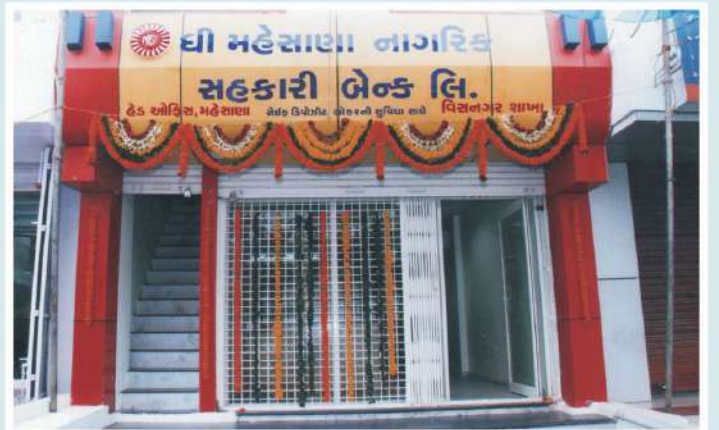
વિસનગર શાખા, વિસનગર