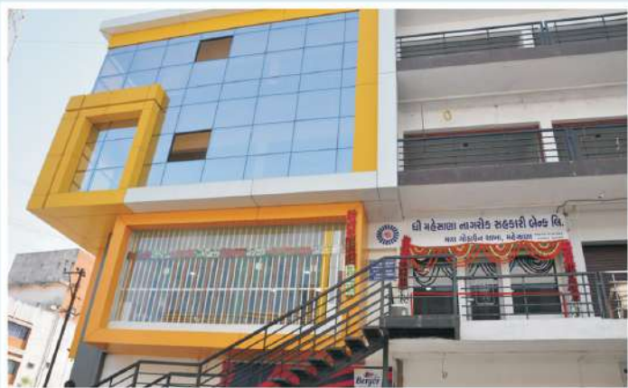
માલ ગોડાઉન શાખા, મહેસાણા