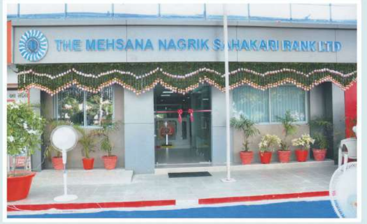
સાયન્સ સીટી રોડ, અમદાવાદ શાખા