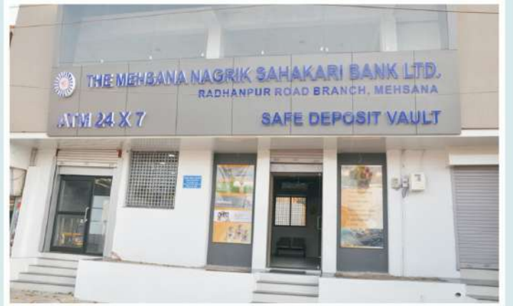
રાધનપુર રોડ શાખા, મહેસાણા