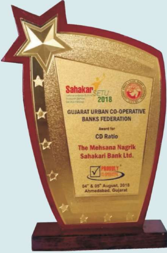
ગુજરાત અર્બન કો-ઓપરેટીવ બેન્કસ ફેડરેશન દ્વારા એનાયત થયેલ એવોર્ડ