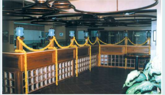
બાપુનગર, અમદાવાદ શાખાનું સંપૂર્ણ કોમ્પ્યુટરાઈઝ્ડ, એરકન્ડીશન્ડ તથા સેઈફ ડીપોઝીટ વૉલ્ડ સાથેનું સ્વમાલિકીનું મકાન સુખસાગર કોમ્પ્લેક્ષ, દિનેશ ચેમ્બર્સ સામે, બાપુનગર, અમદાવાદ. ફોન : ૨૨૨૦૦૪૪૧