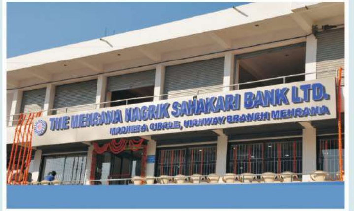
મોટેરા ચાર રસ્તા શાખા, મહેસાણા