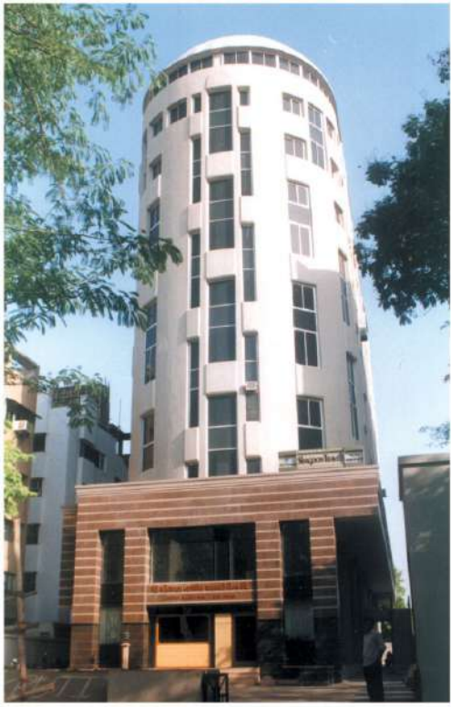
નવરંગપુરા, અમદાવાદ શાખાનું સંપૂર્ણ કોમ્પ્યુટરાઈઝ્ડ તથા એરકન્ડીશન્ડ સ્વમાલિકીનું મકાન આકૃતિ, સ્ટેડીયમ સર્કલ, નવરંગપુરા, અમદાવાદ. ફોન :- ૨૬૫૬૨૭૧૧